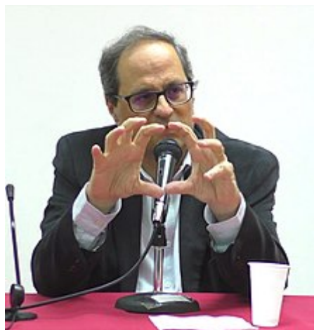
Torra en 2016

Torra, que se autodefine como un «independiente emocional» 21 y se presenta como un hombre que «ha luchado toda su vida por la libertad de su país», es un entregado independentista catalán . Argumentó su entrada en Reagrupament en 2009 de la siguiente manera: «ya no es más catalanismo de derechas o de izquierdas, ni liberalismo o socialdemocracia, ni tan siquiera democracia cristiana o socialismo, hoy la batalla es unionismo o independentismo» 6 .