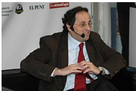
Fotografiado en 2009

Activo en torno a Unión Democrática de Cataluña (UDC) dentro de la corriente crítica de El Matí , 11 en 2009 se incorporó a Reagrupament , una escisión de Esquerra Republicana de Catalunya liderada por Joan Carretero . 12