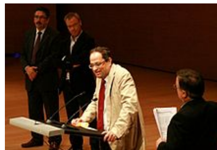
Recogiendo el Premio Carles Rahola en 2009