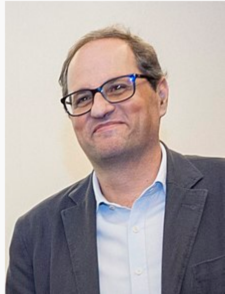
Fotografiado en 2015 durante un acto de Òmnium Cultural